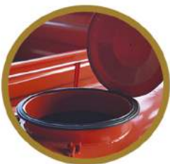
BORRACHA DE VEDAÇÃO RUBBER GASKET CAUCHO DE VEDA