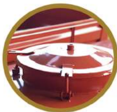
PORTA DE INSPEÇÃO DE 500MM 500MM INSPECTION DOOR PUERTA DE INSPECCIÓN 500MM