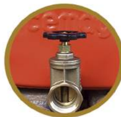
REGISTRO DE SAÍDA OUTLET VALVE REGISTRO DE SALIDA