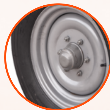
CUBO DE RODA COM PADRÃO AUTOMOTIVO