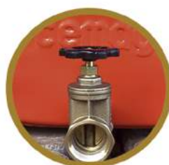
REGISTRO DE SAÍDA OUTLET VALVE REGISTRO DE SALIDA