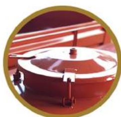
PORTA DE INSPEÇÃO DE 500MM 500MM INSPECTION DOOR PUERTA DE INSPECCIÓN 500MM