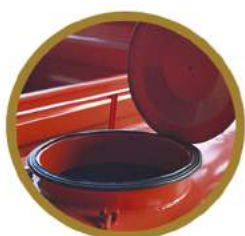
BORRACHA DE VEDAÇÃO RUBBER GASKET CAUCHO DE VEDA